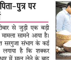
किया गया है कि आरोपियों ने कारोबारियों का विश्वास हासिल करने के लिए छग-ऑडिशा-एमपी शुगर व्यापारी यूनिनयन नाम से एक समूह बनाया था। इस प्लेटफॉर्म के माध्यम से विभिन्न जिलों और राज्यों के व्यापारियों से संपर्क स्थापित कर व्यापारिक नेटवर्क तैयार किया गया। बताया जा रहा है कि इसी नेटवर्क के जरिए कारोबारियों के साथ लेन-देन शुरू हुआ और बाद में बड़े मात्रा में शक्कर उधार में ली गई। होटल में हुई थी कारोबारियों की बैठक: जानकारी के अनुसार रायपुर के रामसागरपारा स्थित एक होटल में शक्कर कारोबारियों की बैठक भी आयोजित की गई थी।