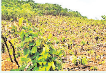
पर जंगल साफ किए जा रहे हैं। कई स्थानों पर सैकड़ों एकड़ क्षेत्र में पेड़ों की कटाई कर जमीन को खेती योग्य बनाया जा रहा है।

जिम्मेदार विभाग आखिर कर क्या रहे हैं? वन विभाग का तर्क है कि अबूझमाड़ का अधिकांश हिस्सा असंबद्ध क्षेत्र है और स्पष्ट रिपोर्ट नहीं होने के कारण कार्रवाई में दिक्कत आती है। सवाल यह है कि यदि रिपोर्ट अधूरे हैं तो उन्हें दुरुस्त करने की जिम्मेदारी किसकी है? और जब तक रिपोर्टें पूरे नहीं होते, तब तक जंगलों को कटने के लिए छोड़ दिया जाए? विडंबना यह है कि यह पूरा इलाका प्रदेश के वन मंत्री केदार करणप के प्रभाव वाले क्षेत्र में आता है। वन संरक्षण की सबसे बड़ी जिम्मेदारी जिस विभाग पर है,