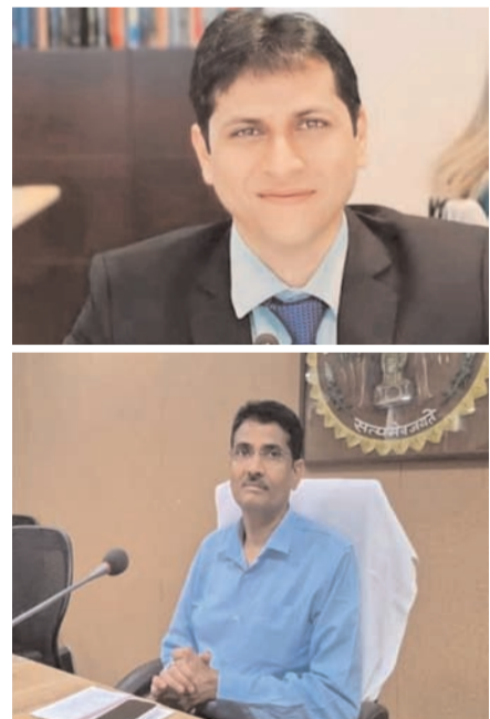
कि जब अधिकारी संवेदनशील होकर जमीन पर उतरते हैं तो तस्वीर खुद बदल जाती है।