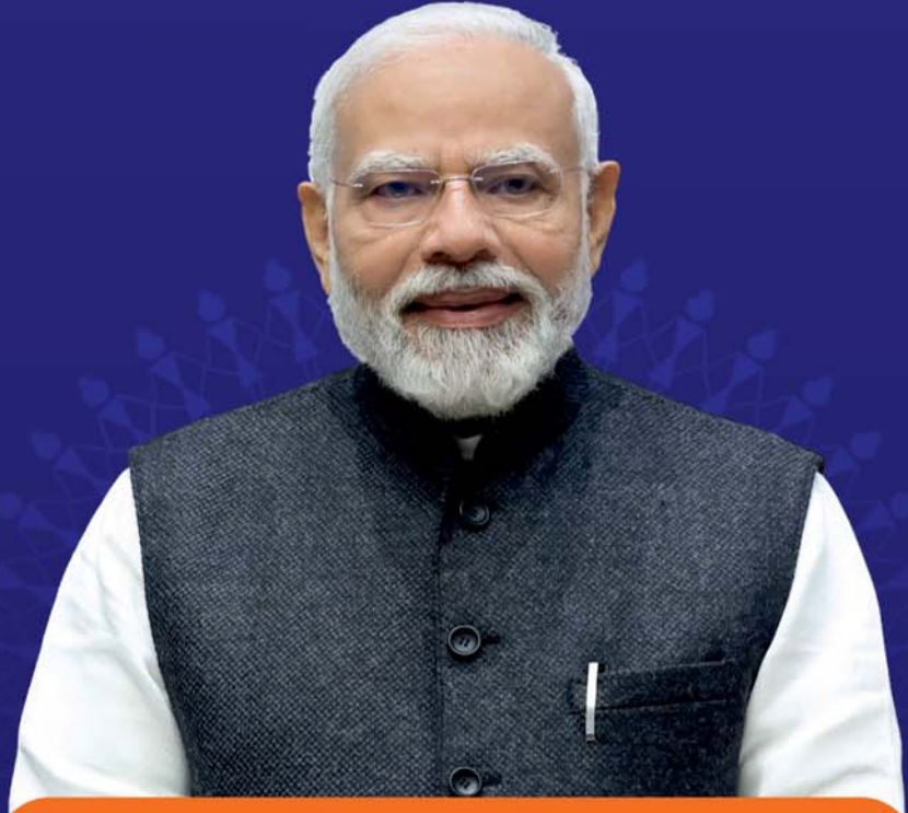
श्री नरेन्द्र मोदी माननीय प्रधानमंत्री