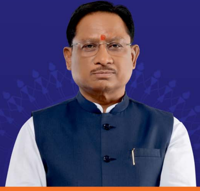
श्री विष्णु देव साय माननीय मुख्यमंत्री, छत्तीसगढ़