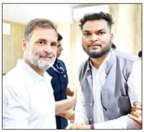
राहुल गांधी को जन्मदिन की बधाई देने पहुंचे जय प्रकाश साहू

प्रवक्ता दुबे ने यह भी कहा कि अब अवैध निर्माण जिन रिसॉर्ट के डायवर्शन नहीं है, जिन रिसॉर्ट में अर्नेतिक आपतिजनक सामग्री मिले है, जहाँ शराबखोरी हो रही है, जो अट्याशी अर्पोषित देह व्यापार का केंद्र बना कर सभ्यता संस्कृति से खिलवाड़ कर रहे हैं, उन्हें जमींदोज करना ही सीधा व सरल उपाय है, क्योंकि अवैध प्लांटिंग या कब्जा से ज्यादा खतरनाक ये अवैध व्यापारियों के रिसॉर्ट है, क्योंकि इनके दुष्कृत्य से इस क्षेत्र की संस्कृति सभ्यता का धरन और अर्नेतिक वातावरण बन गया है। 150 से अधिक रिसॉर्ट में मात्र 15 से 20 को नोटिस जवाब की औपचारिकता से कुछ नहीं होगा, बल्कि सजग कलेक्टर से इस क्षेत्र के रिसॉर्ट का डायवर्शन ना कर अवैध निर्मित रिसॉर्ट को जमींदोज करने की मांग की है।