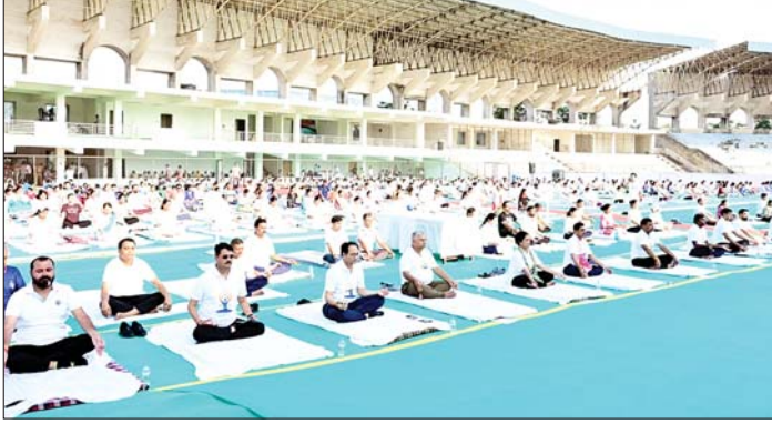
बहतराई स्टेडियम में हजारों लोगों ने किया सामूहिक योगाभ्यास, नशा मुक्ति की ली शपथ

बिलासपुर। केंद्रीय आवास एवं शहरी विकास राज्यमंत्री तोखन साहू के मुख्य आतिथ्य में 12वें अंतर्राष्ट्रीय योग दिवस के अवसर पर बहतराई स्टेडियम में जिला स्तरीय भव्य सामूहिक योगाभ्यास कार्यक्रम आयोजित किया गया। इस वर्ष की थीम योग फॉर हेल्दी एजिंग रही। कार्यक्रम में हजारों लोगों ने उत्साहपूर्वक सहभागिता करते हुए योगासन एवं प्राणायाम का अभ्यास किया।