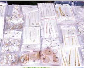
थाना - सिंधोड़ा जिला - महासमुंद्र (छ.ग.)