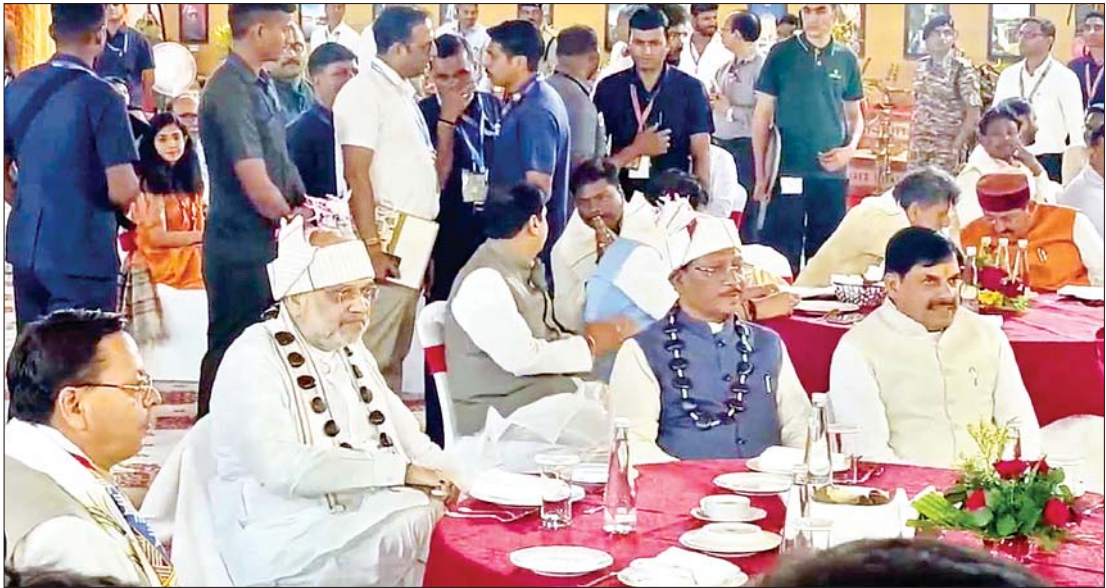
शामिल होंगे, जहां अनौपचारिक चर्चा के साथ बस्तर के विकास और सांस्कृतिक पहचान पर भी बातचीत होने की संभावना है।